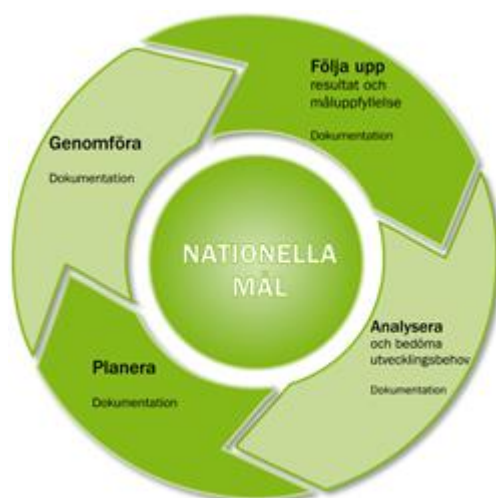
Skolverkets modell av kvalitetsarbetets olika faser (2015-04-17)

och pedagogisk omsorg. Barnhälso teamet som består av förskolechef och specialpedagoger kartlägger, analyserar, dokumenterar och planerar barnhälsans arbete varannan vecka.