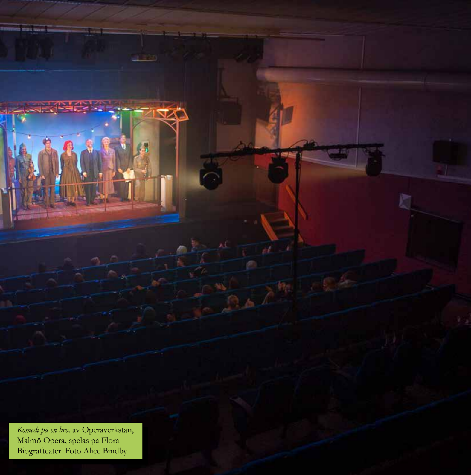
Komedi på en bro , av Operaverkstan, Malmö Opera, spelas på Flora Biografteater.