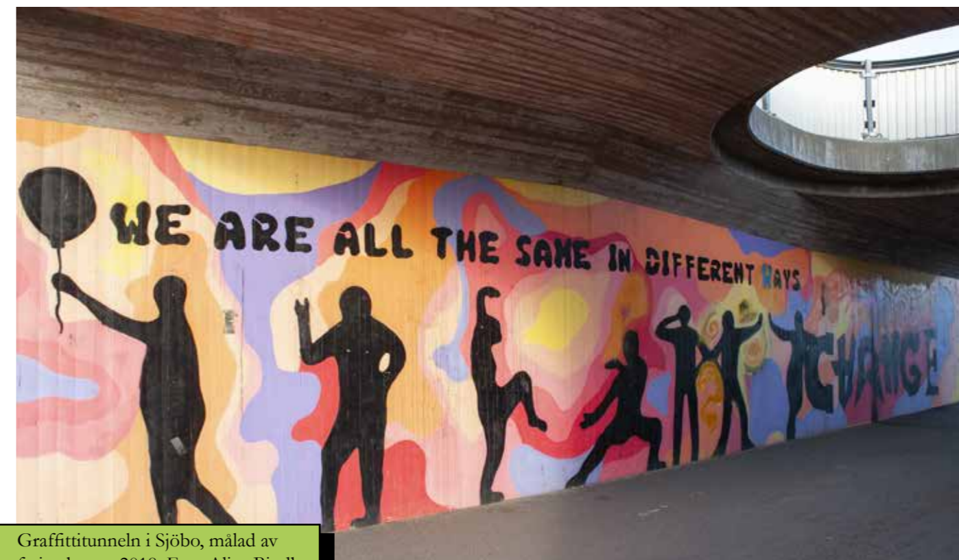
Graffiti-tunneln i Sjöbo, målad av feriearbetare 2018.

I kommunen finns en något högre andel ekonomiskt utsatta äldre, och under pandemin i början av 2020-talet har antalet yngre som lever i ekonomiskt utsatta hushåll ökat. Ungdomsarbetslösheten i Sjöbo ligger på samma höga nivå som Skånesnittet, vilket är högre än ungdomsarbetslöshet i riket. Den sammantagna arbetslösheten i kommunen ökade under pandemins inledande år, men ligger fortsatt under både riks- och Skånesnitt. Arbetslösheten är störst i gruppen män vilket antas beror på att kvinnor i högre grad tenderar vidareutbilda sig och på så sätt har kortare väg till arbete.