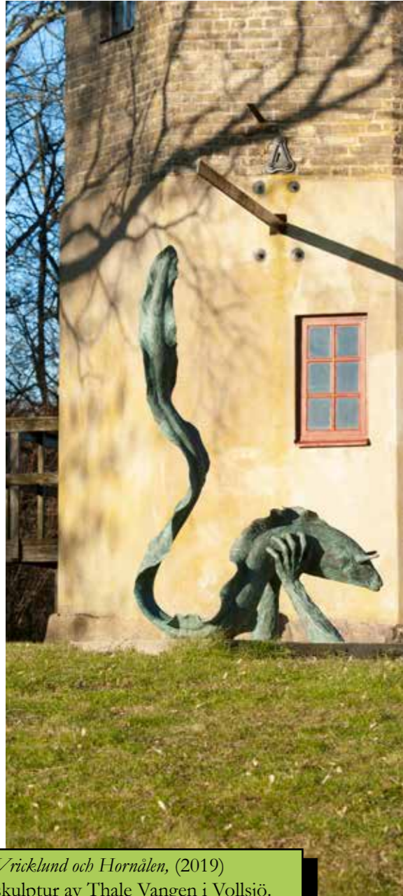
Vricklund och Hornålen, (2019) skulptur av Thale Vangen i Vollsjö.

I grunden handlar det om människans rätt till demokrati, yttrandefrihet och känsla för tillhörighet, och både de mänskliga rättigheterna och barnkonventionen lyfter rätten till kultur. Kulturen öppnar på flera olika sätt upp för individen att tillförskansa sig kunskap, kompetens och bildning. Kulturen pekar framåt och bakåt, och historia och kultur är nära sammanbundna. Genom kulturen får vi avtryck som hjälper oss att förstå och empatisera med våra föregångare och vår egen historia. Mångfalden och kraften i att människor möts genom kultur och får pröva sina idéer utifrån egna förutsättningar bidrar till ett varmt och inkluderande samhälle. Detta är viktigt för en ords attraktivitet, där kulturutveckling bidrar till samhällsutveckling i ett större perspektiv.