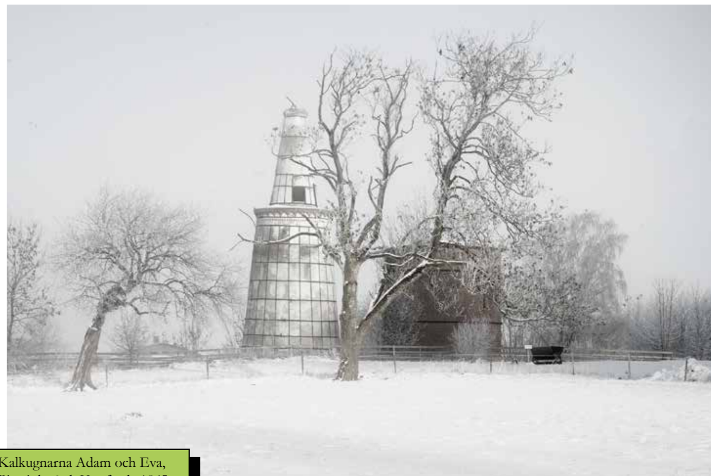
Kalkugnarna Adam och Eva, Bjärsjölagård. Uppförda 1865 resp tidigt 1900-tal. Arkivbild