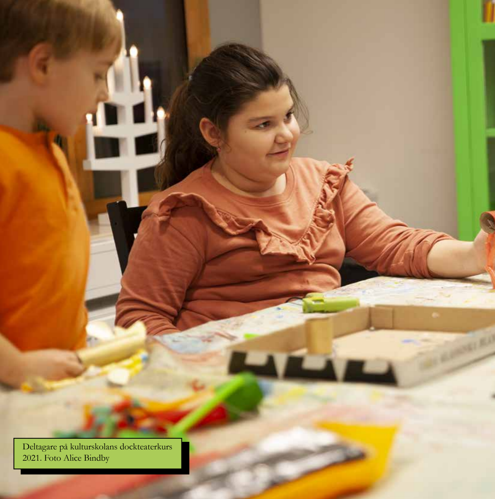
Deltagare på kulturskolans dockteaterkurs 2021.