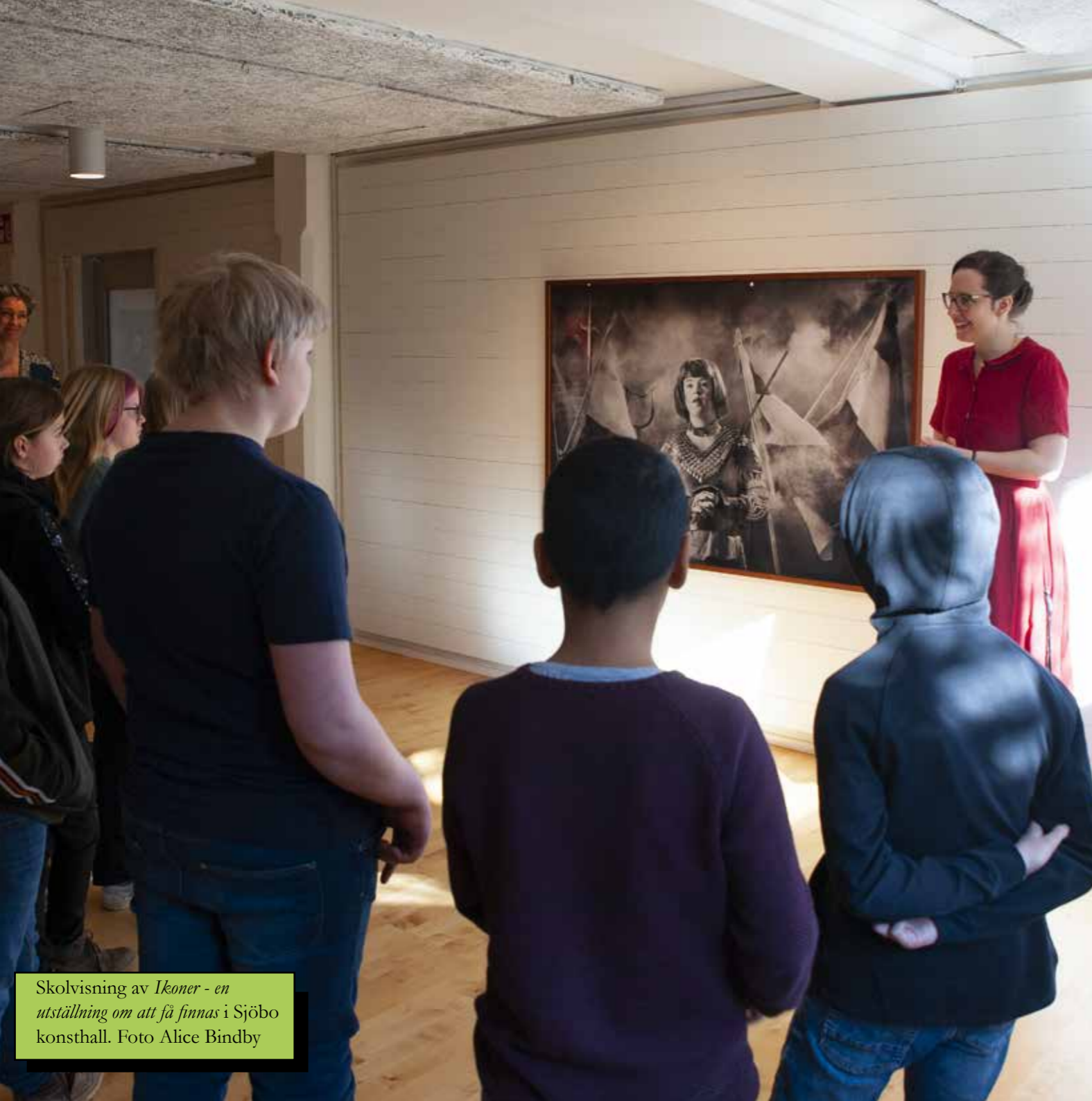
Skolvisning av Ikoner - en utställning om att få finnas i Sjöbo konsthall.