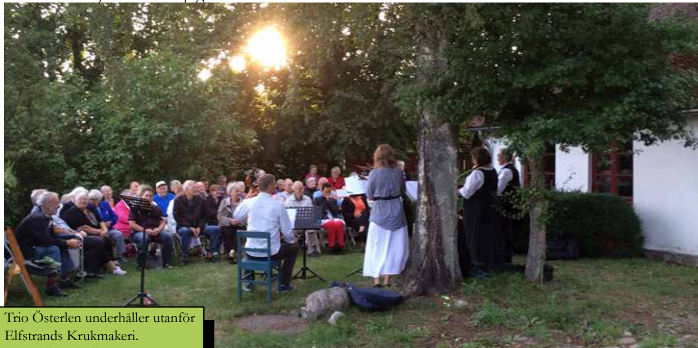
Trio Österlen underhåller utanför Elfstrands Krukmakeri.