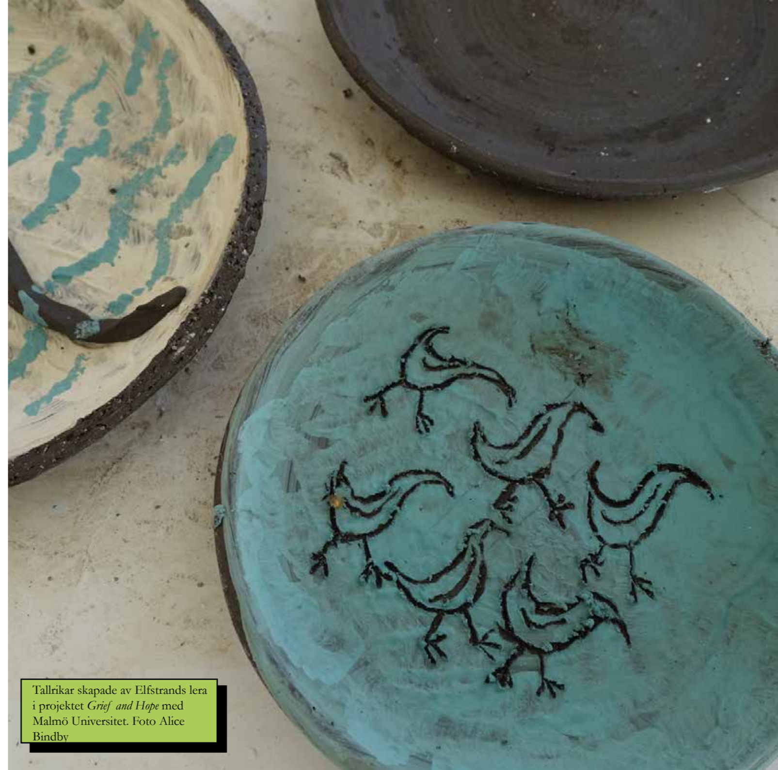
Tallrikar skapade av Elfstrands lera i projektet Grief and Hope med Malmö Universitet.