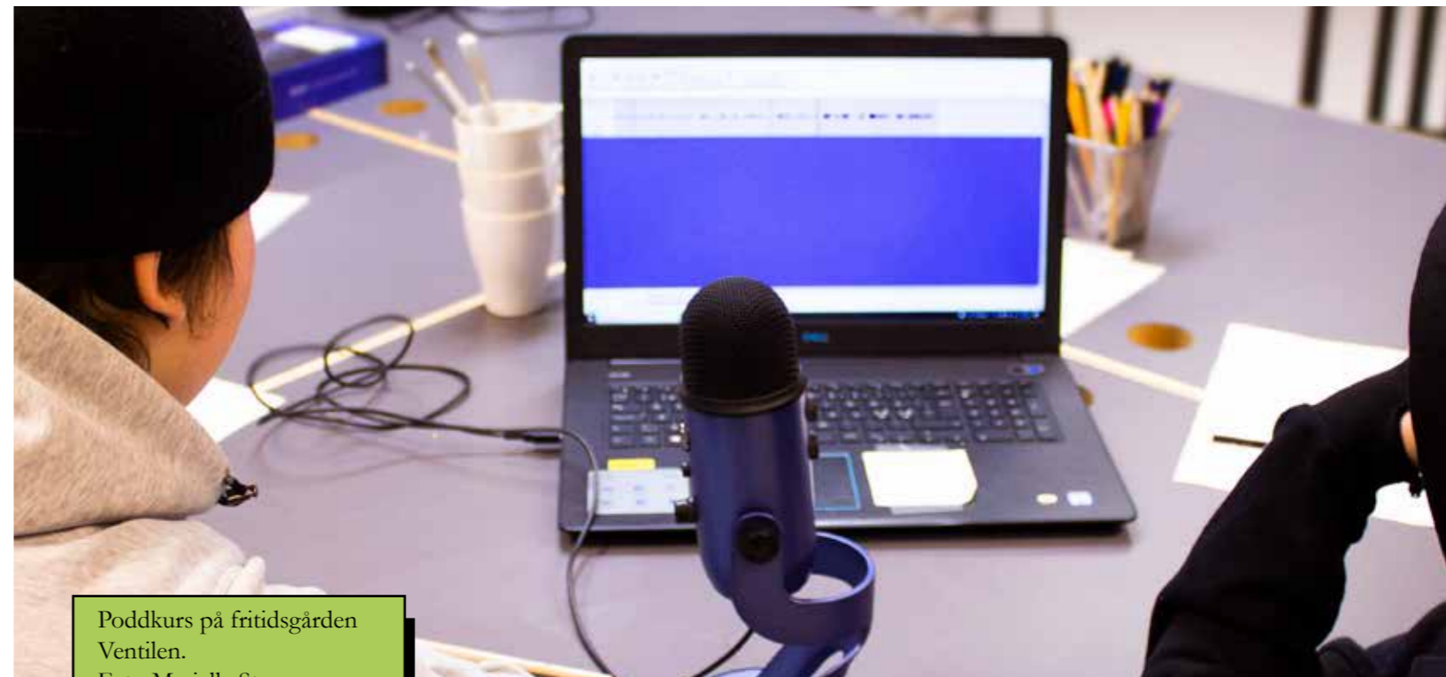
Poddkurs på fritidsgården Ventilen.

Men den påskyndade digitaliseringen har skett snabbt och delvis utan konsekvensanalyser av hur detta påverkar kulturens bredd och djup på längre sikt. Kulturlandskapet kommer troligen att se annorlunda ut i framtiden. Digitaliseringen leder till att allt fler vill vara medskapare snarare än konsumenter, vilket i sin tur ställer högre krav på samverkan och verksamhetsutveckling. Digitaliseringen finns också med som en faktor bakom de ökade klyftor vi ser ekonomiskt, socialt och kunskapsmässigt. För att ta del av den digitala utvecklingen krävs både kunskap och teknisk utrustning, vilket gör att vissa grupper får ett allt tydligare försprång. De grupper som hamnar på en digital efterkälke får också högre trösklar till demokratin i samhället och till den utveckling som sker i ett framtida digitalt landskap.