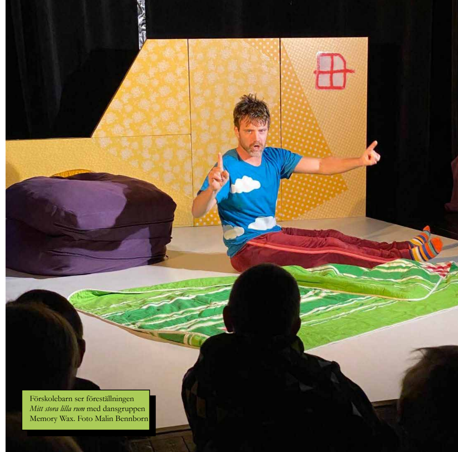
Förskolebarn ser föreställningen Mitt stora lilla rum med dansgruppen Memory Wax.