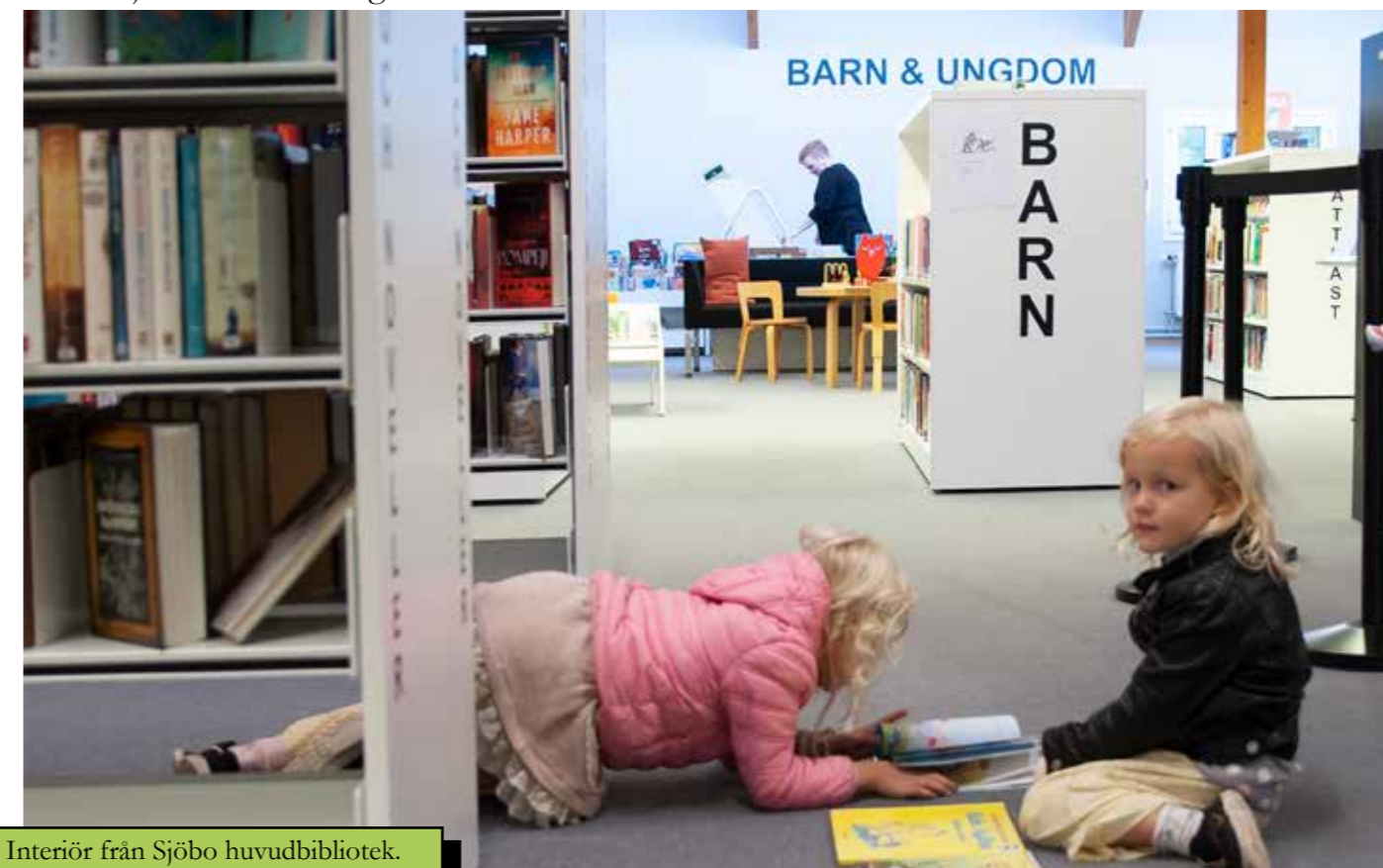
Interiör från Sjöbo huvudbibliotek.

Sjöbo ska vara en plats där det erbjuds nya och innovativa kulturyttringar sida vid sida med traditionella kulturyttringar. Såväl bred populärkultur som smalare kultur bereds plats, och kan både skapa nyfikenhet och öka antalet invånare som beskriver sig själva som delaktiga kulturutövare.