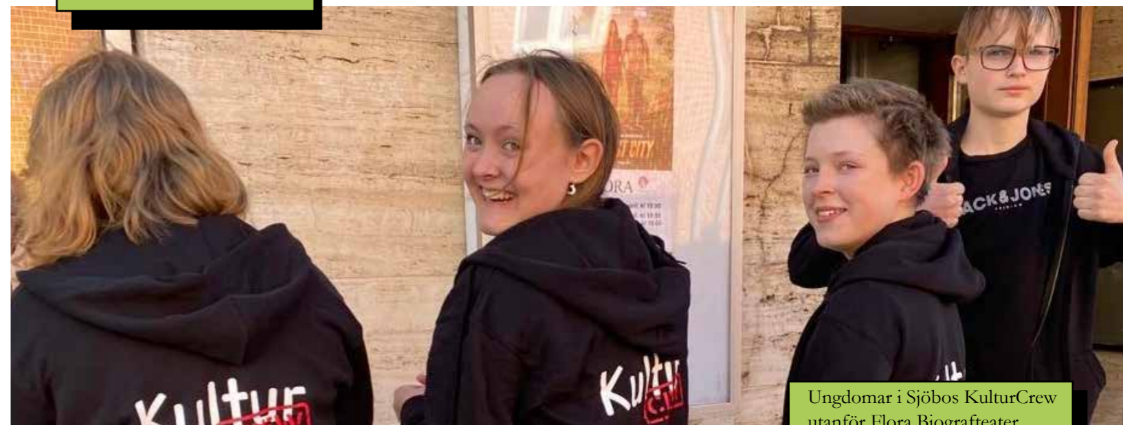
Ungdomar i Sjöbos KulturCrew utanför Flora Biografteater