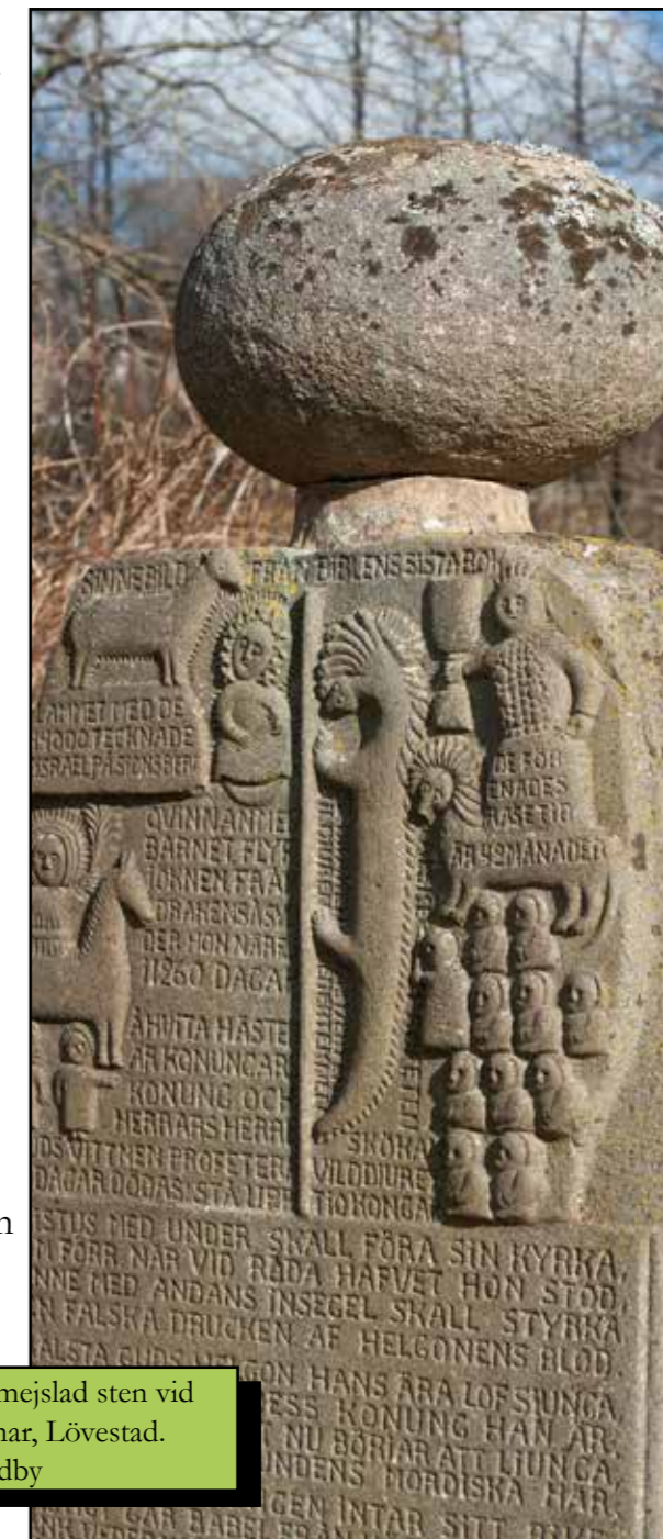
Detalj från en mejslad sten vid Hallsbergs Stenar, Lövestad.

Medborgarna i Sjöbo kommun ska ha kunskap och förståelse för kultur, inte bara som ett fritidsintresse utan som en del av samhällets väv. Medborgarna ska också stärkas att uppleva, utöva och delta i kultur för dess egen skull, snarare än av nyttoaspekter. En kommun där medborgarna utövar och deltar i kulturaktiviteter är en kommun med hög livskvalitet. Kommunen har också ett ansvar för att bevara, utveckla och värna om de kulturaktörer som finns och verkar i kommunen, samt att tillsammans med samverkanspartners utveckla och stärka det utbud som finns.