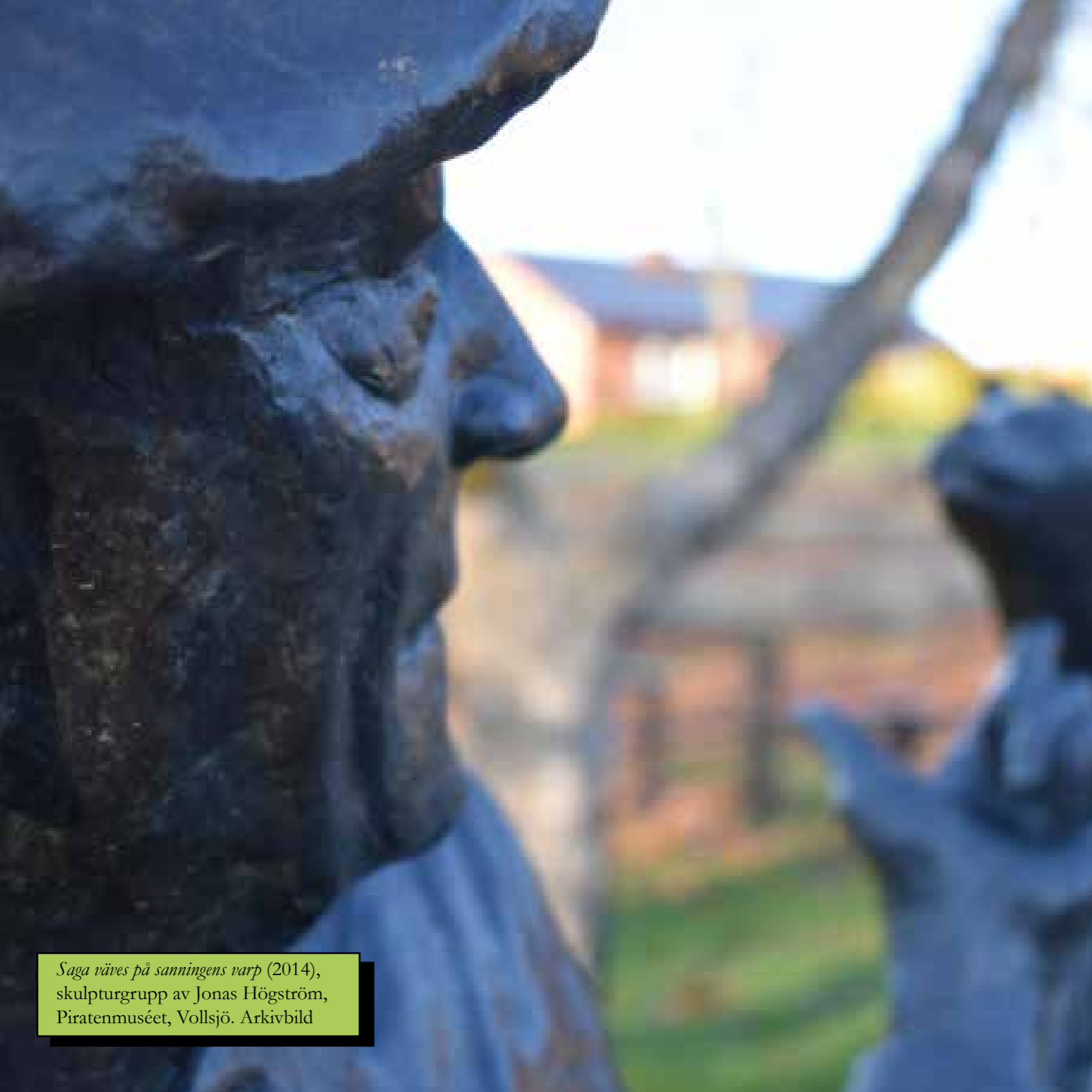
Saga väves på sanningens varp (2014), skulpturgrupp av Jonas Högström, Piratenmuséet, Vollsjo. Arkivbild

Tillgänglighet är en viktig fråga för alla medborgare, men särskilt för de med fysiska och psykiska funktionsvariationer. För dessa grupper blir både god fysisk tillgänglighet och möjlighet att få guidning, hjälp och stöd enormt viktig för att kunna ha ett kvalitativt liv. Det är viktigt att se på tillgänglighet ur olika aspekter, såväl fysisk som kommunikativ tillgänglighet, för att alla medborgare oberoende av förutsättningar ska kunna ta del av dem. Vi som kommun ska granska våra verksamheter för att se hur väl de uppfyller krav på tillgänglighet och skapa målsättningar för hur denna kan öka.