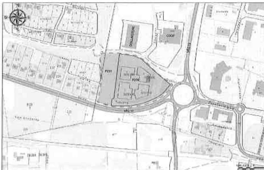
Bild 1. Blåmarkerat område är det föreslagna planområdet, även gällande detaljplaners utberedning inom planområdet är markerat.

Gällande detaljplaner som berörs är P270 samt del av P231. Genomförandetiden har ej löpt ut för detaljplan P270 (genomförandetid t.o.m. 2018-07-11).