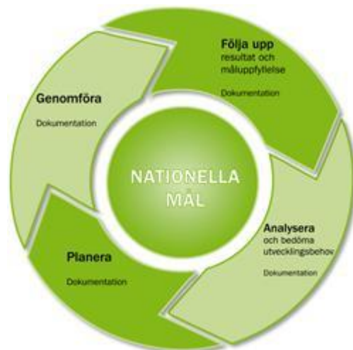
Skolverkets modell av kvalitetsarbetets olika faser.

9 § Barn som av fysiska, psykiska eller andra skäl behöver särskilt stöd i sin utveckling ska ges stöd som deras speciella behov kräver. Om det genom uppgifter från förskolans personal, ett barn eller vårdnadshavare framkommer att ett barn är i behov av särskilt stöd, ska förskolechefen se till att barnet ges sådant stöd. Barnets vårdnadshavare ska ges möjlighet att delta vid utformningen av de särskilda stödinsatserna.