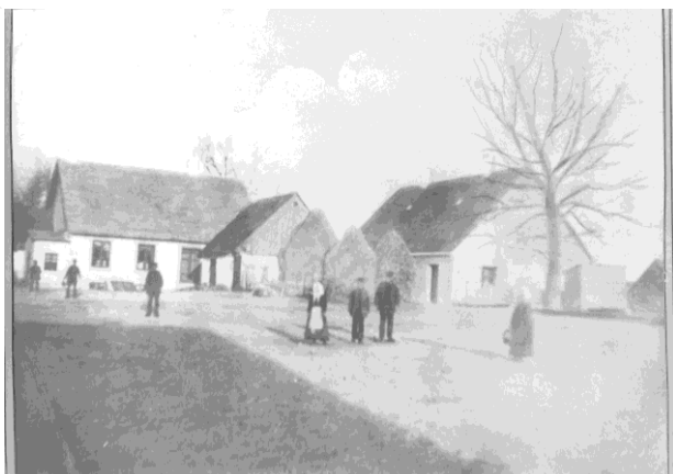
Sjöbo Gästgivaregård omkring 1890. Till höger vid stora almen, tingshuset. I lilla uthuset bakom vedstackarna fanns hållstall för häradshövdingens hästar.

Bilden är tagen söderifrån, ungefär från dagens korsning Östergatan/Götgatan