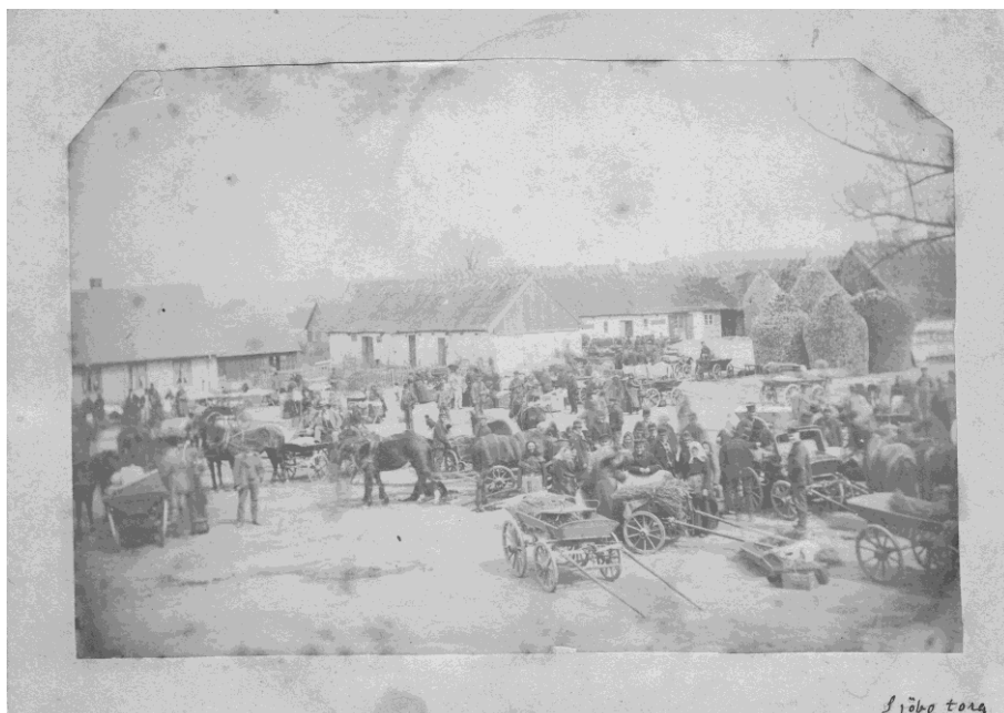
Sjöbo Torg 1870-talet med Gästis i bakgrunden

Om du går vidare mot norra sidan av Gamla torg fortsätter berättelsen om platsen, och vad som hände en varm, torr sommardag strax efter förra sekelskiftet!