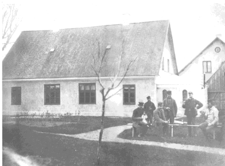
Gamla Tingshuset (byggår 1771) med nämndemän som styrker sig

Bilden är tagen söderifrån, ungefär från dagens korsning Östergatan/Götgatan